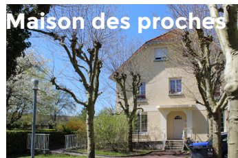
Maison des proches

Chargée de Relations Usagers 01 69 23 20 08 Coordonnateur Général des Soins 01 69 23 20 65